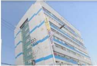
대전광역시이동일시청소년쉼터 (청소년복지시설/ 청소년쉼터)