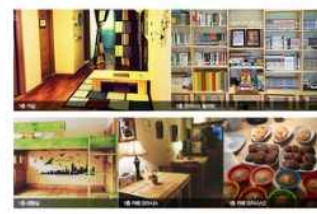
대전광역시교육청남학생가정형Wee센터 터 (가정형Wee센터)