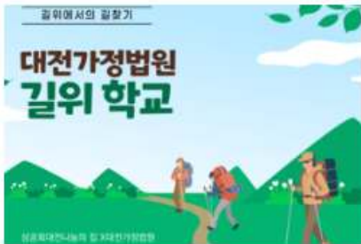
길위학교 프로그램 (협력기관: 대전가정법원)