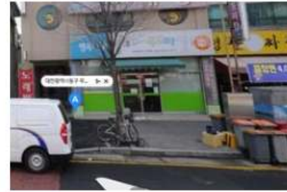
대전행복나눔무지개푸드마켓2호점 (기부식품등 제공사업장/푸드마켓)