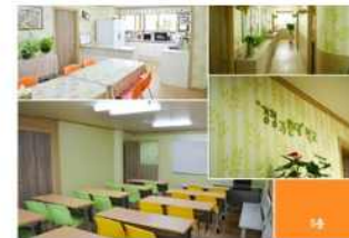
대전광역시교육청여학생가정형wee센터 터 (가정형wee센터)